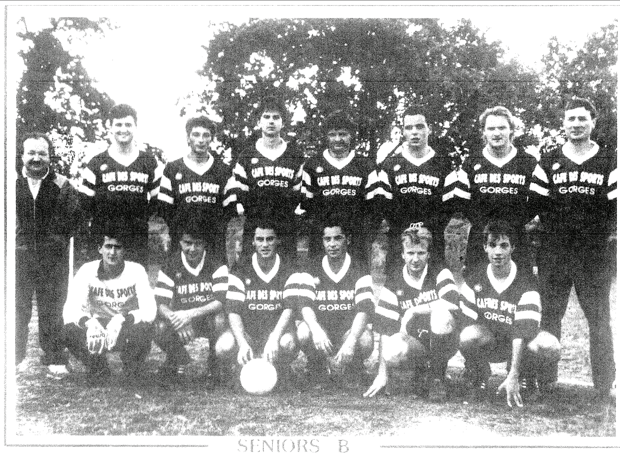
La photo officielle de l'équipe de 93-94.