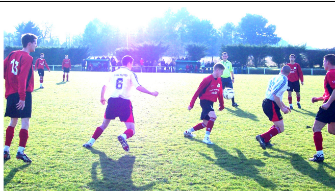
Mini audj fait parler la technique

Le tirage des 1/4 de finale a été effectué le jeudi 19 février au siège du district en présence des représentants de tous les clubs qualifiés. Les affiches sont les suivantes :