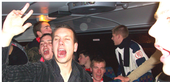
Les cordes vocales ont souffert au retour...

Nb : Une participation de 5 € a été demandée à tous les passagers du car, joueurs y compris. Le club a pris en charge le complément des frais de location, soit 150 €.